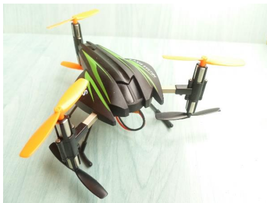
Obr.1 Použitá demonstrační hexakoptéra Scorpion S-max