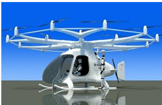
Obr.5 Volokoptéra VC200 projektu e-Volo je první dvoumístná volokoptéra na světě

Příkladem v současnosti pravděpodobně nejvyzrálejší konstrukce multi-rotorového stroje je Volokoptéra německé firmy e-Volo [8], která by zanedlouho měla být běžně v prodeji. Zbývá jen realizovat rozsáhlé vytrvalostní zkoušky kabiny pro cestující, přistávacího rámu a rotorového pole. V Německu by pak lidé s leteckým oprávněním mohli už v blízké budoucnosti létat i na volokoptérách e-Volo .